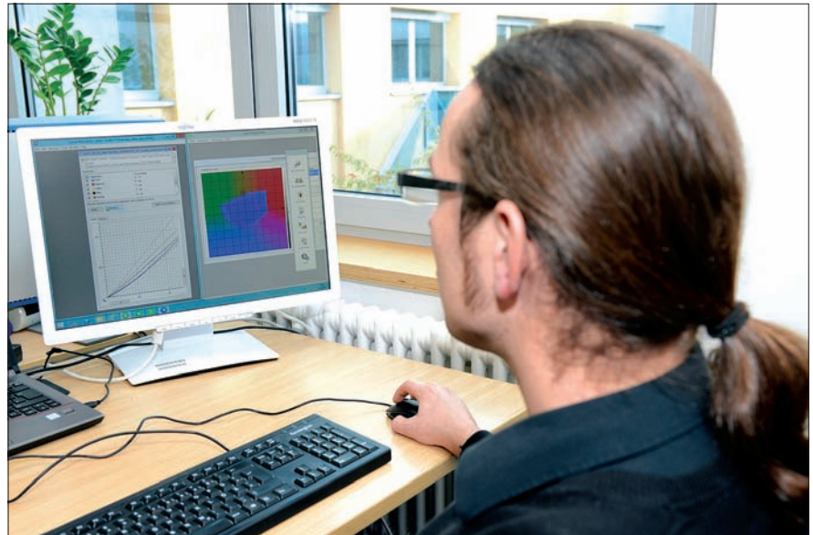
Megnövelt színtér speciális márkaszínek helyett

Az érdeklődő felhasználók mindezt Radebeulban, a Koenig & Bauer nyomtatási centrumában a gyakorlatban is megnézhetik. A folyamatintegráció egyik terméke az Equinox colormenedzsment-megoldás, ami a nyomtatásnál megnövelt színteret valósít meg a szükséges RIP-architektúra felhasználása mellett. A megnövelt színterű nyomtatás esetén nem szükséges különleges festékeket használni, ami