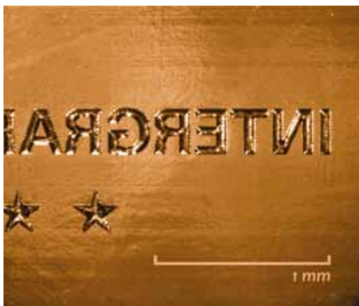
HD Flexo technológiájú klisé 1 pontos negatív szövege

Az igazi értékelést nyomdai partnereinktől és megrendelőiktől várhatjuk, osztályozni ők fognak. Bízunk benne, hogy ötcillagos klisékkel kiérdemelhető a csillagos ötös.